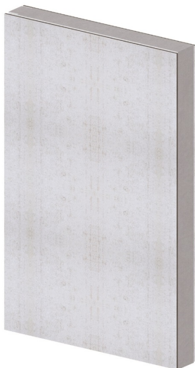
Rys. 1: Standardowy kompozytowy panel SIP

Produkt wykonany jest na bazie paneli kompozytowych SIP z zaimplementowanym niskotemperaturowym systemem ogrzewania powierzchniowego. Typowy panel SIP (Rys. 1) zbudowany jest z okładzin magnezowych MgO Green grubości 11mm oraz styropianowego rdzenia grubości 150mm. Do głównych składników płyt MgO Green należy tlenek i chlorek magnezu, perlit oraz siatka z włókna szklanego znacząco poprawiająca parametry wytrzymałościowe. Parametry płyty magnezowej MgO Green oraz typowego panelu kompozytowego SIP przedstawiono w aprobatkach technicznych.